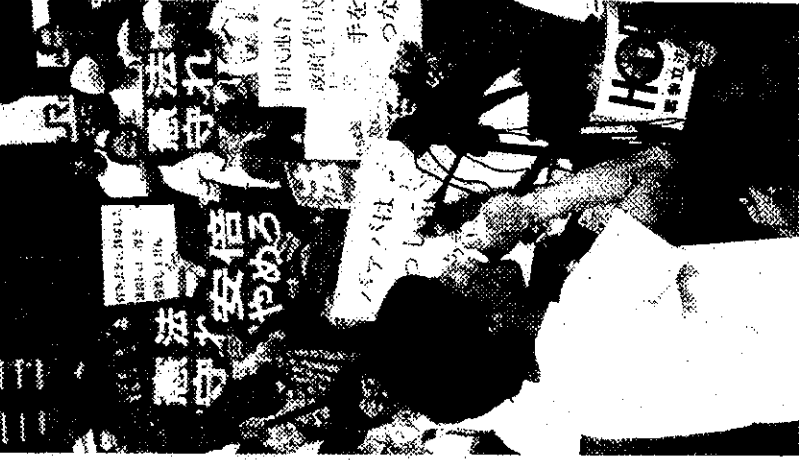
戦争法廃止、安倍内閣打倒を訴え、名古屋駅西口噴水前を埋めた学生と市民 9月27日、名古屋駅前

立憲主義・民主主義・平和主義を破壊する安倍政権を打倒し、戦争法の廃止をめざす運動が展開されています。9月27日に名古屋駅前でおこなわれたSEALEDs（シールズ＝自由と民主主義のための学生緊急行動）TOKAI（東海）の街頭宣伝には約1500人が集まりました。日本共産党が19日発表した「戦争法（安保法制）廃止の国民連合政府」実現の提案に賛同が広がっています。